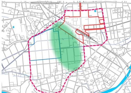
▲みどり色の部分が浪江駅西側地区公民連携まちづくりエリア

全提案者のプレゼン終了後は、オンライン参加者も含むセミナー参加者全員で「いいね」投票を実施。公民連携セミナー（第3回）に向けて、浪江駅西側地区における公民連携まちづくりの可能性、方向性を皆さんと共有する場となります。